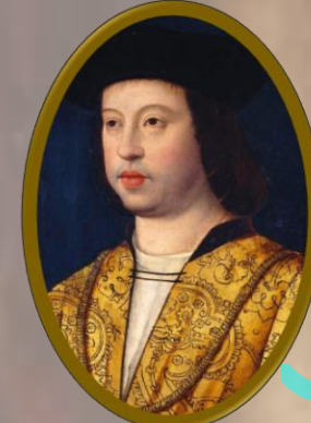
Ferdinando II d'Aragona (†1516)