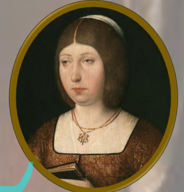
Isabella I di Castiglia