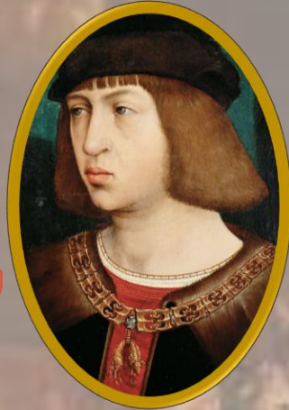
Filippo il Bello (†1506)