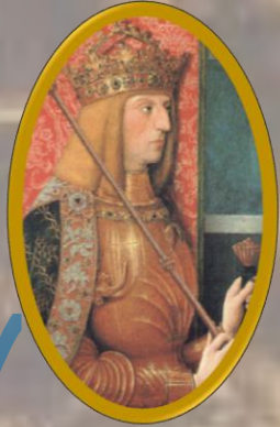
Massimiliano I d'Asburgo (†1519)