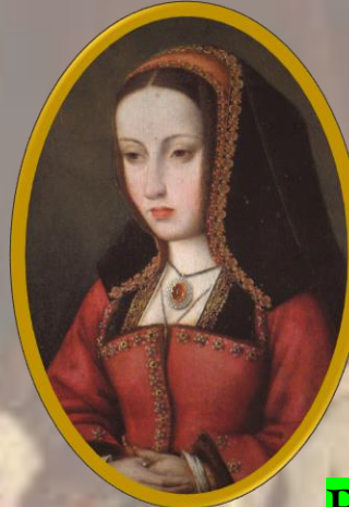
Giovanna la Pazza