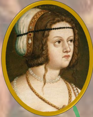
Bianca Maria Sforza