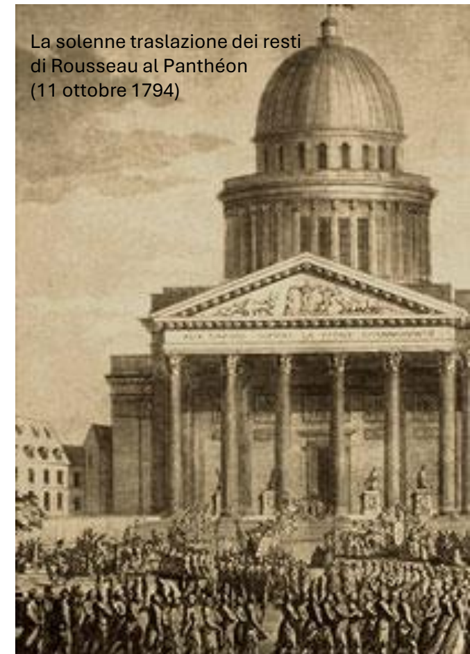
La solenne traslazione dei resti di Rousseau al Panthéon (11 ottobre 1794)